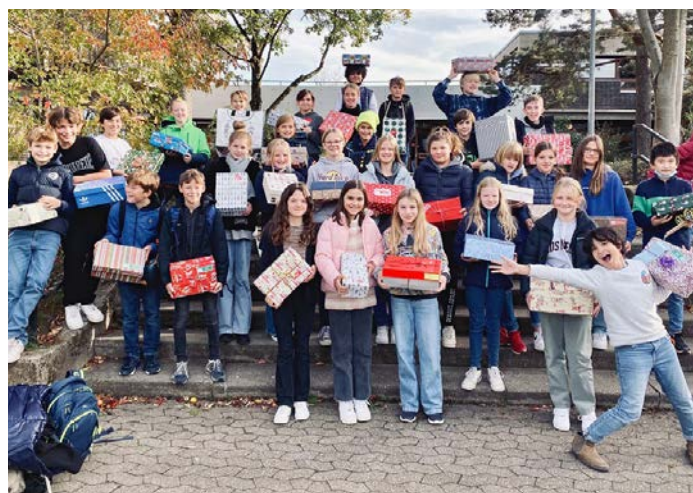
Aktion „Weihnachten im Schuhkarton“ der Klasse 6a

Anfang November nahm die Klasse 6a von Rebecca Adloff an der Aktion „Weihnachten im Schuhkarton“ – Geschenkaktion der christlichen Hilfsorganisation Samaritan's Purse – teil, wobei die Schüler*innen 32 Weihnachtspakete mit Spielzeug, Süßigkeiten, Schulmaterial etc. packten. Die Schuhkartons wurden anschließend mit schönem Papier und Schleifen dekoriert. Zudem legten die Schüler*innen Briefe bei und hoffen, dass dadurch Brieffreundschaften entstehen. Die Pakete gehen an Kinder in Rumänien und der Ukraine. Begleitet wurde die Aktion durch Gespräche über die Bedeutung der Geschenke für Kinder, die es nicht gewohnt sind, an Weihnachten mit vielen Geschenken überrascht zu werden.