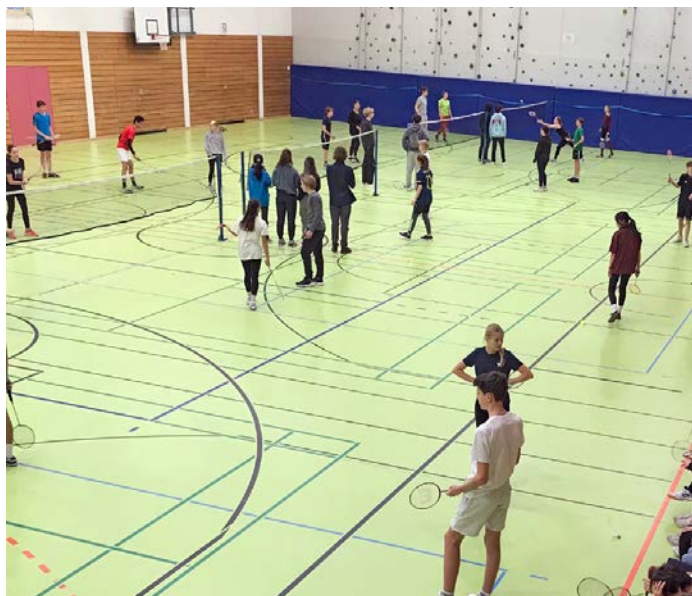
Badminton-Spieler*innen beim TFG-Spielfest

Nach der Pause durch die Corona-Pandemie konnte erstmals auch wieder das Spielfest der Sport-Fachschaft des TFG stattfinden. Dabei traten die Klassen in jeweils drei Teams gegen die anderen Klassen ihrer Jahrgangsstufe an. Das jeweilige Sportspiel wurde dabei zuvor durch eine Reihe im Sportunterricht vorbereitet (5. Klassen: Brettball, 6. Klassen: Basketball, 7. Klassen: Hockey, 8. Klassen: Fußball, 9. Klassen: Badminton). Die Schüler*innen der EF fungierten bei den Spielen als Schiedsrichter*innen. Vielen Dank für diesen Einsatz! Ein besonderes Kunststück beim Spielfest gelang der Klasse 9a: Sie belegte als einzige Klasse mit allen drei Mannschaften den ersten Platz. Im nächsten Jahr müssen sie dann im Volleyball antreten, was für die 10. Klassen vorgesehen ist.