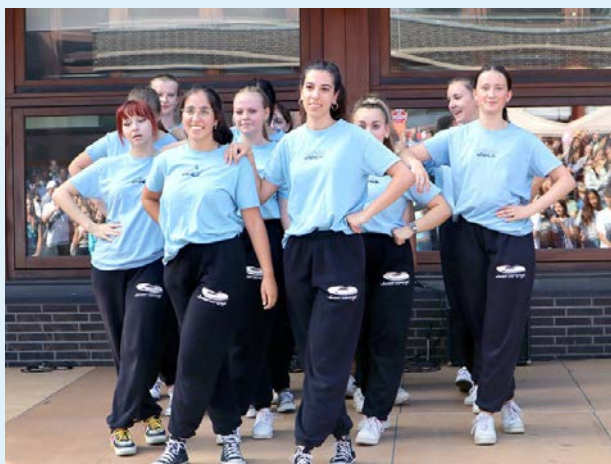
[Plakat: M. Brandstetter-Korinth]