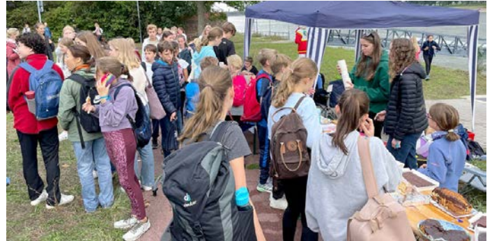
Erfolgreiches Spendensammeln beim Charity Walk

Die Schüler*innenvertretung freut sich über 75.000 Euro, die beim diesjährigen Charity Walk zusammengekommen sind! Gut ein Drittel der zu verteilenden Summe geht an das Kinderhospiz Regenbogenland, ca. ein Viertel an die Alte Feuerwache in Wuppertal und an die Kaiserswerther Diakonie, die mit dem Geld Kinder und Jugendliche aus Kriegs- und Krisengebieten unterstützt, sowie ungefähr ein Sechstel an die Schulpartnerschaft mit Tansania. Allen Spender*innen sowie Aktiven einen ganz großen Dank für diese unfassbar hohe Geldsumme!