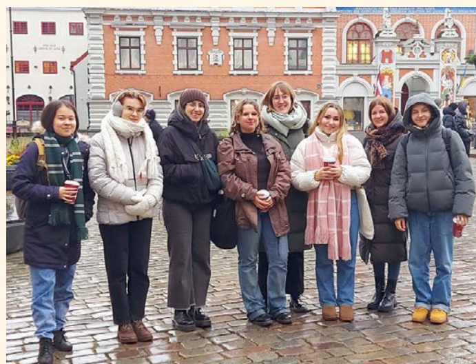
Die Erasmus-Projektgruppe in Riga

Im November startete ein Team mit sechs Schüler*innen aus der Q2 in Begleitung von Johanna Wintersohle und Katharina Braun zu einem einwöchigen Erasmus-Projekt in die lettische Hauptstadt Riga. Dort arbeiteten sie zusammen mit Schüler*innen aus Polen, Portugal, Lettland und der Türkei an einem Literaturprojekt zum Thema „Kultur“. So wurden beispielsweise Filmrezensionen von den Schüler*innen verfasst. Zudem bot das Treffen Gelegenheit die lettische Kultur kennenzulernen. Die Gruppe erlebte dabei auch die Woche, in der Rigas Unabhängigkeit gefeiert wurde, bei der beispielsweise schöne Lichtertraditionen auf dem Schulhof zu entdecken waren.