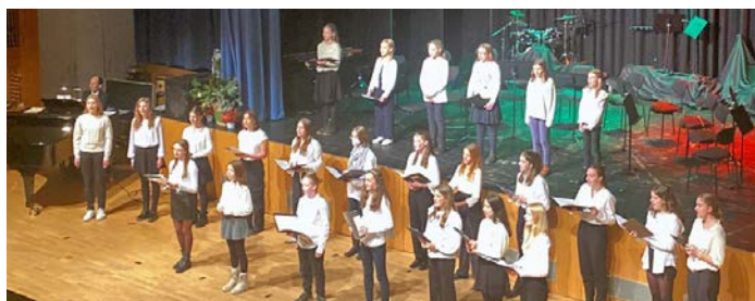
Impression des Adventskonzerts

Nach der Pause, in der die Q2 ein umfangreiches Catering aufbot, ging es beschwingt mit einer von Schüler*innen selbst initiierten TFG-Adventscombo weiter. Diese spielte Pop- und Jazz-Hits der Adventszeit. Danke für einen rundum gelungenen Abend und wiederum einen musikalischen Höhepunkt unseres Schuljahres!