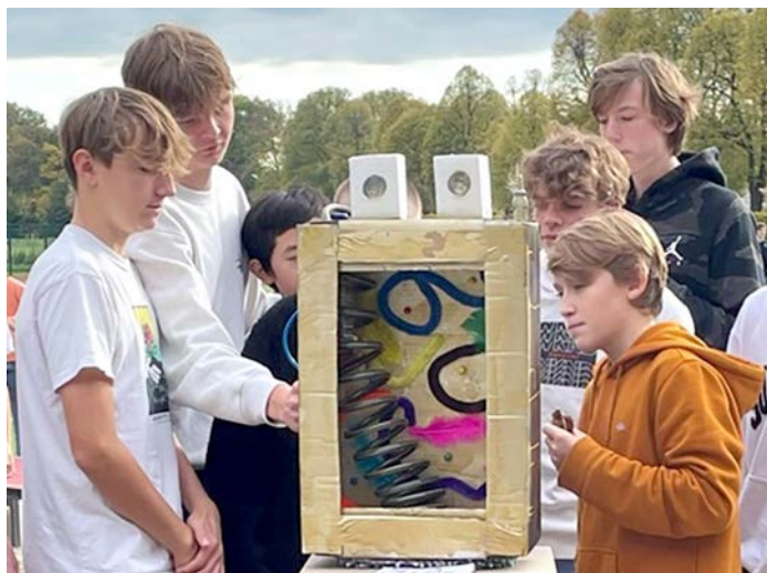
Großes Interesse an der Kunstausstellung der Klasse 8b