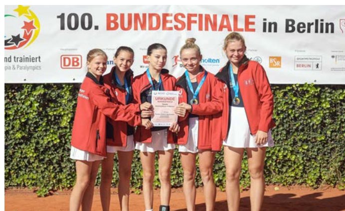
Das TFG-Tennis-Team beim Bundesfinale in Berlin

Ebenfalls erfolgreich waren die Volleyball-Schulmannschaften des TFG : Je zwei Vizemeister-Stadtmeistertitel holten die Mädchen und Jungen der Wettkampfklasse II. Die Mädchen unterlagen dabei der International School Düsseldorf mit 0:3. Die Jungen mussten sich im Finalspiel dem Gymnasium Gerresheim geschlagen geben. Das Ergebnis von 2:0 Sätzen zeigt dabei aber nicht den engen Spielverlauf, der auch zugunsten des TFG hätte ausfallen können. Allen beteiligten einen herzlichen Glückwunsch!