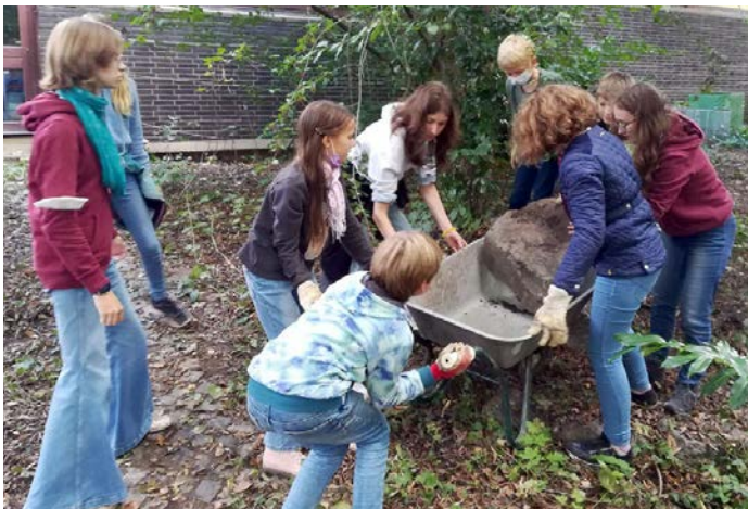
Die Umwelt-AG im Einsatz

Umweltschutz ist in aller Munde. Die neue Umwelt-AG unter Leitung von Judith Roepke will jedoch nicht nur darüber reden, sondern aktiv werden und einen Teil dazu beitragen, die Welt ein bisschen bunter und artenreicher zu gestalten. Etwa 15 Schüler*innen der Klassen 5 bis 9 planen seit September deshalb den Bau eines neuen, klimafreundlichen und bunten Schulgartens. Das Gelände ist groß, die Ideen noch größer. Voller Elan wurde als erstes Projekt eine Kräuterschnecke angelegt und bepflanzt. In den Wintermonaten will die AG neben der Recherche und Planung beispielsweise den Vögeln mit Vogelfutter helfen. Im Frühjahr wird die AG mit dem Bau eines Gemüsegartens starten, eine Blumenwiese anlegen sowie eine Sitzecke bauen. Die Umwelt-AG freut sich über weitere Mitglieder*innen jeden Alters. Auch die Expertise von Eltern ist herzlich willkommen, beispielsweise bezüglich der Teichanlage, die gegebenenfalls im Frühjahr erneuert werden soll (Kontaktaufnahme über judith.roepke@ekir.de ).