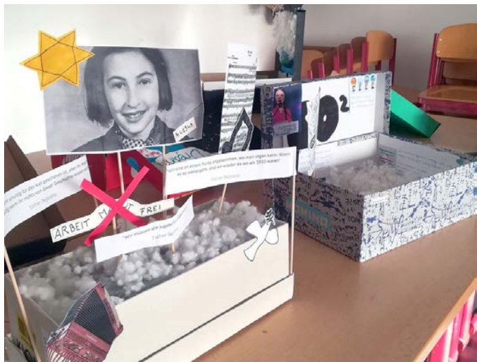
Prophetenkisten aus der Klasse 7d