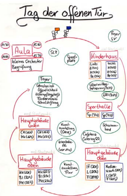
Rundgang am Tag der offenen Tür am TFG

Der Tag der offenen Tür Ende November interessierte viele mögliche neue Schüler*innen aus den Grundschulen. In insgesamt 38 Gruppen mit jeweils ungefähr zehn Schüler*innen plus Begleitpersonen wurden die Gäste auf einem Rundgang durch das Gebäude des TFG geführt. Dabei gab es nach dem informativen Start in der Aula viele Mitmachaktionen, Ausstellungen oder Vorführungen der