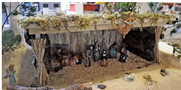
Weihnachtskrippe der Schule für Circuskinder

Schüler*innen der Schule für Circuskinder in NRW der Evangelischen Kirche im Rheinland haben in einem Projekt eine Weihnachtskrippe selbst gebaut und dem TFG mit passenden Figuren zur Verfügung gestellt. In der Adventszeit ist die Krippe im Selbstlernzentrum des TFG aufgebaut. Wir freuen uns sehr über dieses liebe Geschenk und bedanken uns sehr herzlich!