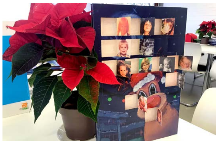
Adventskalender-Aktion der Q2 am TFG

Nach einer erfolgreichen Erstaufgabe im letzten Jahr hat die Jahrgangsstufe Q2 wieder einen TFG-Adventskalender gestaltet. Diesmal gibt es hinter den 24 Türchen Kinderbilder von Mitarbeitenden des TFG zu entdecken. Der Kalender stieß auf große Resonanz bei den Schüler*innen: Insgesamt wurden 500 Kalender verkauft. Die Einnahmen gehen auf das Stufenkonto zur Finanzierung der Aktivitäten des Abiturjahrgangs.